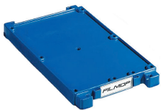
Base PM : Réf. 07102001/P