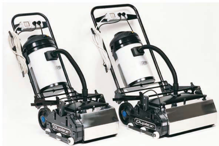
Support de guidage breveté