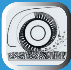
Elimination des poussières