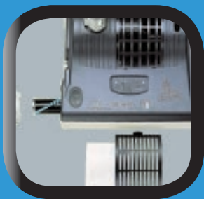
Changement de brosse et de filtre sortie d'air