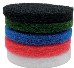
27-170-04421300 Pads - Ø165