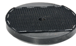
25-150-01531010 Plateau Velcro Ø150