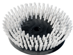
25-160-01532010 Brosse Nylon Ø175 - 0,5mm