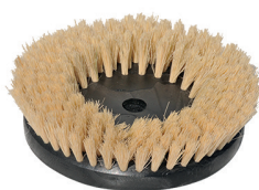
25-160-01532210 Brosse Tampico Ø175