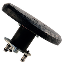
25-150-01593010 Articulation*** Ø150