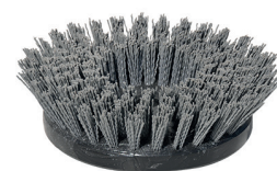
25-160-01535110 Brosse Tynex Ø175 - 1,02mm