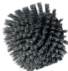
25-160-01538010 Brosse d'angle Tynex Ø150 - 1,02mm