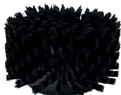
25-160-01536010 Brosse d'angle Nylon Ø150 - 0,5mm