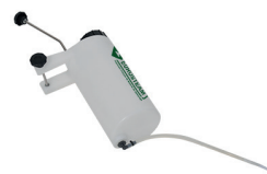
25-140-01590100 Réservoir 2,5L Compatible uniquement sur l'ES153