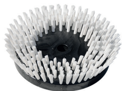
25-160-01532810 Brosse Nylon (shampoing moquettes) Ø175 - 0,3mm