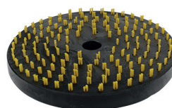
25-150-01534010 Plateau Picots Ø150