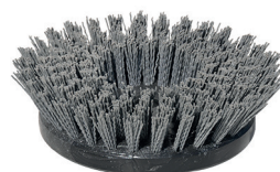
25-160-01535010 Brosse Tynex Ø175 - 0,46mm