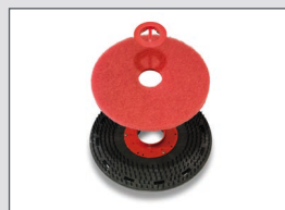
Plateau disque avec son système Padloc