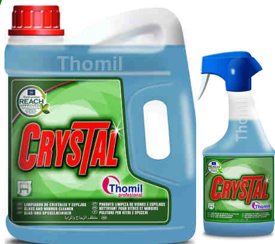
Nettoyant pour vitres et miroirs