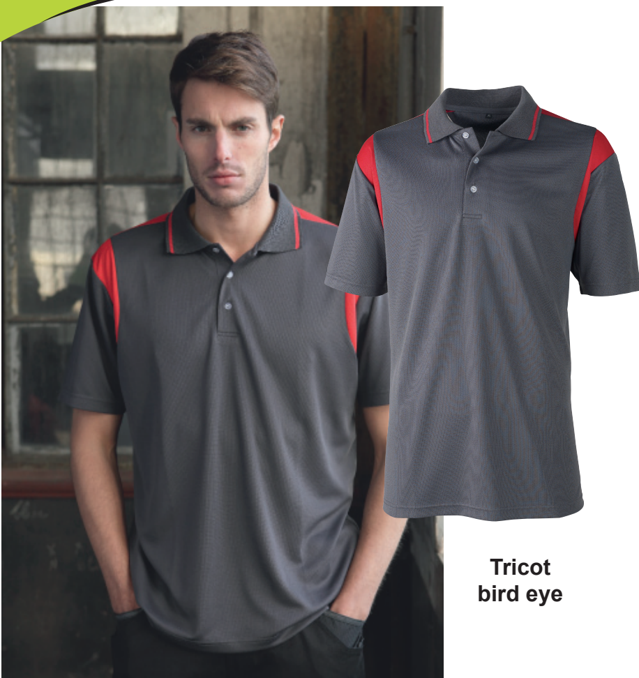
Tricot bird eye