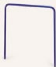
Art L620291 per Hotel 918 Art L620281 per Hotel 915-916 Montante blu per Green portabiancheria Blue stanchion for Green line trolleys Blauer Holm für Green Wäschewagen Montant bleu pour chariot linge "Green" Montante azul para portabiancheria Green