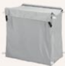
Art 00003665 per Hotel 916 - 617 Sacco in tessuto 200 lt con zip e coperchio Bag 200 lt. with zip and cover Sack 200 lt. Mit Deckel und Reißverschluss Sac zippé en tissu gris 200 lt. avec couvercle Saco de tejido de 200 l. con cremallera y tapa