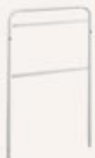
Art H320090 per Hotel 917 Montante in rilsan Rilsan stanchion Holm aus Rilsan Montant en rilsan Montante acero rilsan