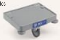
Art T063253 (Ø 125 mm) Piatto reggisacco con ruota Bag support with castor Platte mit Stützrad Plateau support sac avec roue Plato de soporte del sacco con rueda