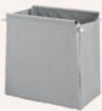
Art 00003664 per Hotel 915 Sacco in tessuto grigio 200lt. Bag 200 lt - grey Sack 200 lt. - grau Sac en tissu gris 200 lt. Saco de tejido gris 200l.