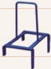
Art H660921 Giunto per carrello portabiancheria Blue connection for Green laundry trolleys Blaue Verbindung für Green Wäschewagen Joint bleu pour chariots linge Unión para carro portabiancheria