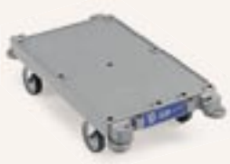
Art T092312 per Hotel 918 Art T092303 per Hotel 915-916-917 Base con ruote Base with castors Grundgestell mit Rädern base avec roues Base con ruedas Ø 125 mm