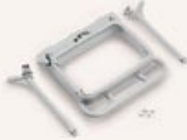
Art 5070312 Portasacco in plastica grigio 120 lt Grey plastic bag holder 120 lt Grauer Kunststofftaschenhalter 120 lt Support sac en plastique grise 120 lts Portasaco plastico gris 120 lt