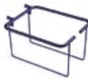
Art L660666 (quadruplo/quadruple) Art L660661 (doppio/double)

Reggi vaschetta porta flaconi. Holder for objects or bottle basket Halterung für Flaschenkorb Structure pour panier porte-bouteilles ou objects Portapapel