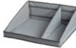
Art 00003679 cm 66x46 Art 00003677 cm 46x46

Portasacco 70 lt. con tendisacco Bagholder 70 lt. with bag-pulling arches Sackhalter 70 lt. mit Spannungssystem Support sac 70 lt. avec fixe-sac Soporte de sacos de 70 lt. con tensores de saco