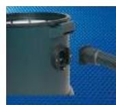
Connexion de cuve emboîtable