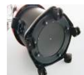
5 roulettes multi-directionnelles