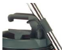
Poignée Multi-fonctions + câble détachable