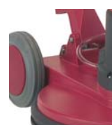
Moteur décentré permettant un meilleur équilibre