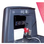
Version chargeur intégré IBC