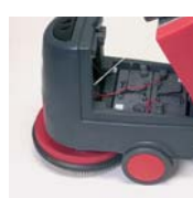
Accès rapide aux batteries