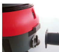
Connexion de cuve emboîtable