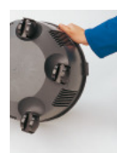
5 roulettes multi-directionnelles