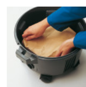
Mise en place facile du sac