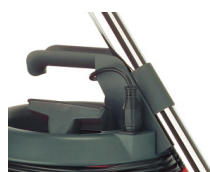
Poignée Multi-fonctions + câble détachable