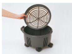
filtre coton S10+