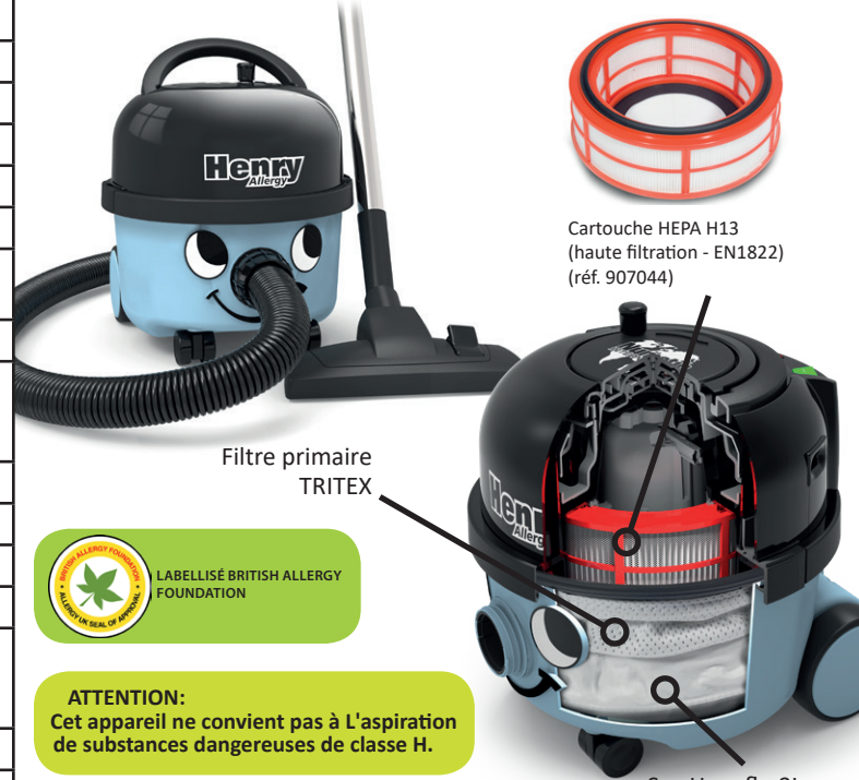
Cartouche HEPA H13 (haute filtration - EN1822) (réf. 907044)