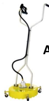
A Médium DIAMETRE 45 CM